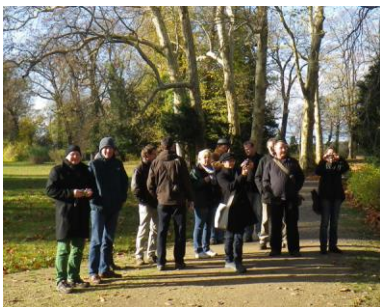
Exkursion auf die Pfaueninsel